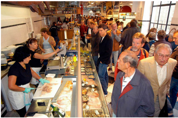
Die Markthalle wird zum Exportschlager – nicht nur Madison hat Interesse an dem Konzept.