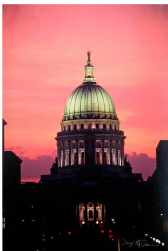
Durch die Zusammenarbeit bei der Ökologie bekommt die Städtepartnerschaft zwischen Freiburg und Madison eine neue Dimension.