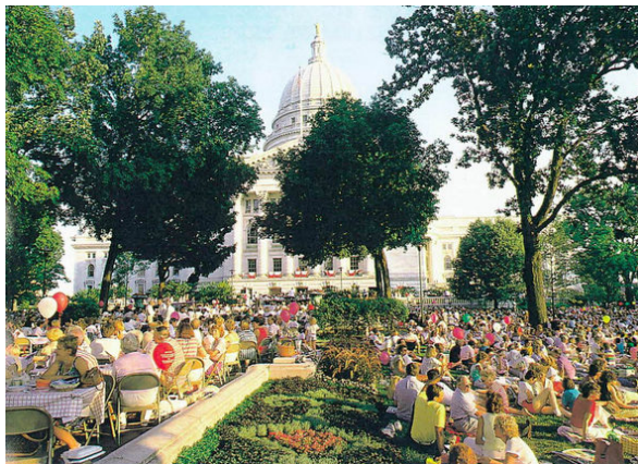
Das Wahrzeichen von Madison ist das Capitol. In dessen Nähe soll die Markthalle von Madison gebaut werden. Foto: ---